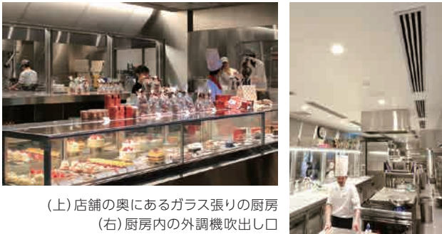
(上) 店舗の奥にあるガラス張りの厨房 (右) 厨房内の外調機吹出し口

「八日市の杜」の厨房は店舗内にあり、ルーフトップ外調機(クリーンエア仕様)から供給される新鮮外気で陽圧を保ちながら、外部からの空気の侵入を防いでいます。「お店は人の出入りがある工場のような完全密封ができません。そのため給排気バランスにはとても気を使います。粉を扱う現場では集塵機や換気扇が常に稼働していて排気が多い。導入当初からチューニングを繰り返して、今は外調機(RFT-COA)を使いこなせていると感じています。」小野林シェフのこだわりは、温湿度管理や空気の流れにまで及びます。